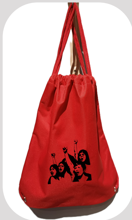
SAC A DOS