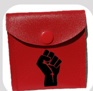
CENDRIER DE POCHE